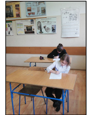
Olimpiada z religii w Szkole Podstawowej w Dukli .