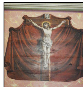
Freski w prezbiterium i w nawie kościoła.