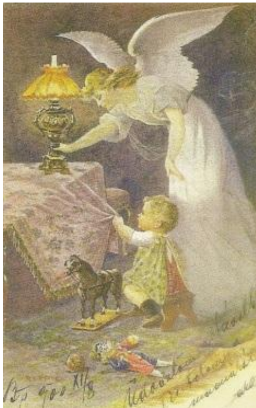
Lampa naftowa nie była bezpieczna w użyciu