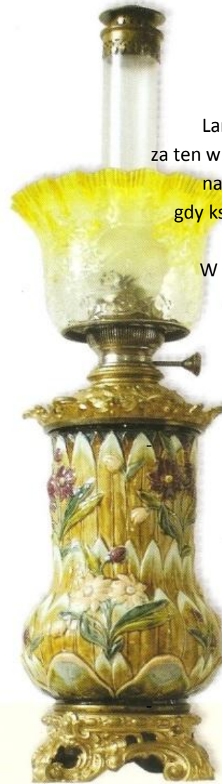
Austriacka lampa majolikowa

Nikt nie pomyśli, gdy światło zapali: Służyłaś wiernie wieczornemu Światu? 2