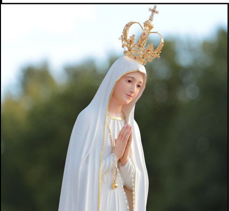
Figura Matki Bożej Fatimskiej wyruszała zgodnie z orędziem i prośbą na Ukrainę...

Sanktuarium Matki Bożej Różańcowej w Fatimie opuściła figurka Maryi, która na terytorium Ukrainy odbędzie pielgrzymkę w intencji pokoju w tym zaatakowanym przez Rosję kraju. Nawrócenie Rosji to przesłanie zawarte w objawieniach maryjnych z Fatimy, to słowa wzywające do modlitwy za Rosję.