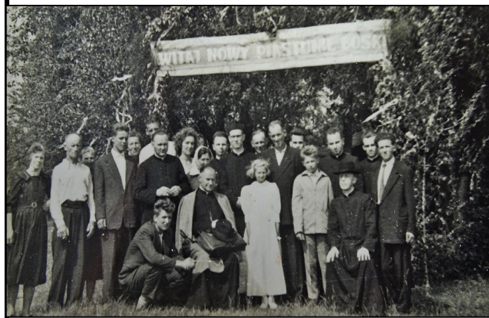
Uroczystości prymicyjne, Wietrznie 26 czerwiec 1961, fotografia ze zbiorów rodziny Longawa – Sajdak.