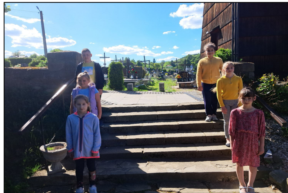
Klasa trzecia - Szkoły podstawowej im. Ignacego Łukasiewicza...