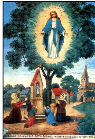
Chcę, abyście codziennie odmawiali Różaniec

Rząd włoski podjął szereg działań, aby zapewnić przyjęcie dla milionów pielgrzymów. Jedną z inicjatyw było ustanowienie tzw. „Karty Pielgrzyma”, która na terytorium Włoch była równoważna z paszportem.